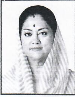
श्रीमती वसुन्धरा राजे